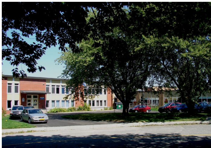
L'école Champlain, août 2010.

Autres dénominations pour l'établissement : s.o.