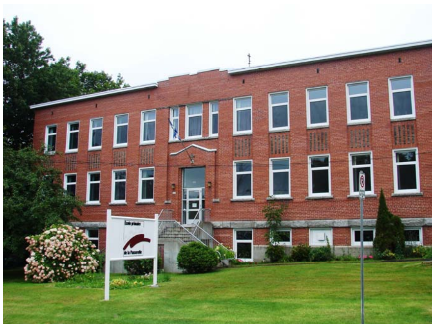
L'école de la Passerelle, août 2010.

Autres dénominations pour l'établissement : École no 2 (1911-1917), École no 1 (1917-1949), Notre-Dame-de-Tout-Pouvoir (1949-1993) et École de la Passerelle, pavillon no 1 (1993-2009)