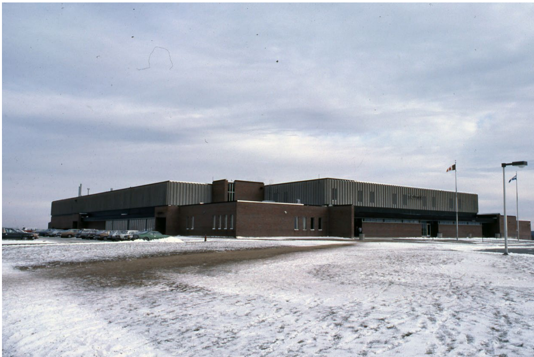
École secondaire du Phare, vers 1978.

Autres dénominations pour l'établissement : Polyvalente Ouest 1-A (1971-1975) et École secondaire du Phare (1975-2011)