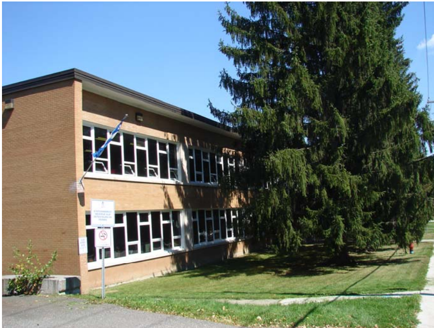
Le bâtiment de la nouvelle école construite en 1960-62, août 2010.

1 er avril 1962 : bénédiction de la nouvelle école Saint-Antoine 28