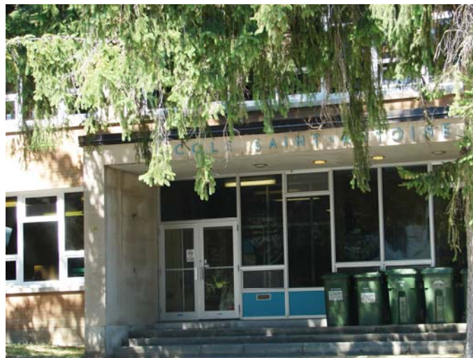
L'école Saint-Antoine, août 2010.

Autres dénominations pour l'établissement : s.o.