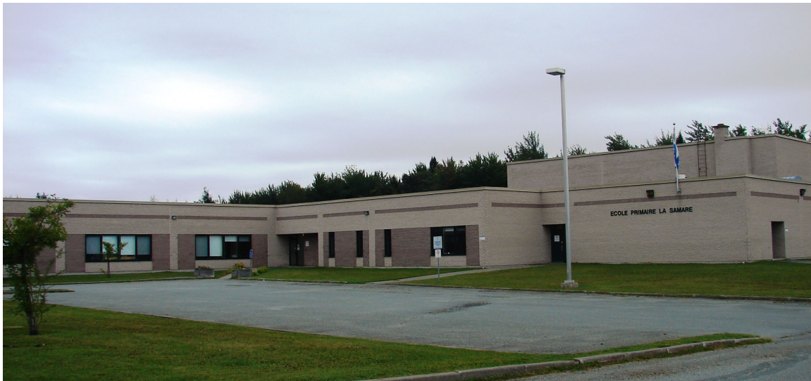
L'école de la Samare, août 2010.

Autres dénominations pour l'établissement : s.o.