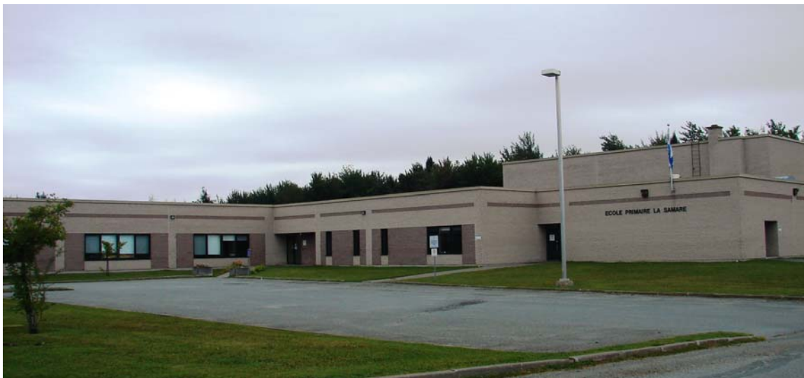
L'école de la Samare, août 2010.

Autres dénominations pour l'établissement : s.o.