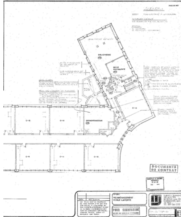
Détail du plan d'agrandissement de l'école Laporte, mai 1988. (P-012-001-053, FC.18 Plans des établissements de la CSRS)

1 er juin 1988 (CE 88-15462) : le CE accorde le contrat général de réaménagement de l'école à Construction Cloutier & Fils inc., pour la somme de 363 963 $ 21