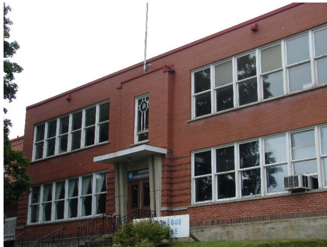
L'ancien couvent Notre-Dame-Auxiliatrice, août 2010.

11 septembre 1990 (CE 90-16319) : le CE autorise la vente de l'école et du terrain de l'immeuble (lot 28T-2 du 1 er rang du canton d'Ascot, d'une superficie d'environ 4 613 mètres carrés) à la Municipalité d'Ascot Corner pour la somme nominale de 1 $ 53