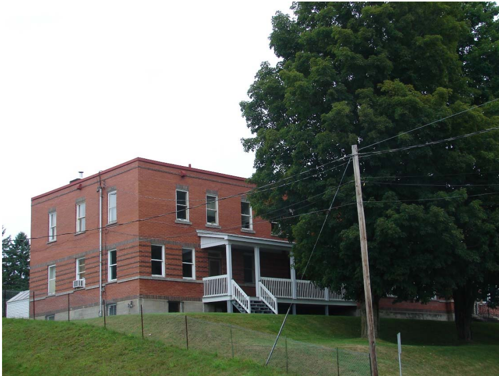
L'ancien couvent Notre-Dame-Auxiliatrice, août 2010.

Autres dénominations pour l'établissement : École centrale du village (1901-1942), École Saint-Stanislas (1942-1952), Couvent Notre-Dame-Auxiliatrice (1952-[197?]) et École Saint-Stanislas ([197?]-1990)