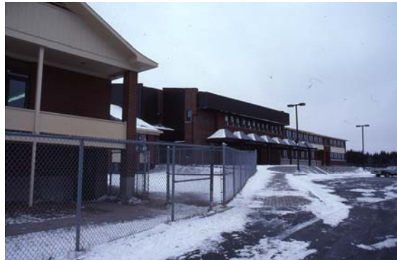
L'école Alfred-DesRochers, après la fusion de 1981. ( Fonds CHLT-TV, Société d'histoire de Sherbrooke, IP310 )

Le chapitre le plus récent s'ouvre en 1978, lorsque le Ministère de l'Éducation du Québec autorise « un agrandissement qui relierait les deux écoles » et qui permettrait d'ajouter des classes régulières, des classes de maternelle et un gymnase. En septembre 1980, le contrat d'agrandissement et de fusion des écoles est finalement accordé. L'école Alfred-DesRochers, née de la fusion des écoles Vierge-Immaculée et Saint-Pie-X, est officiellement inaugurée le 31 août 1981. Depuis, d'importants travaux d'agrandissement et de mise à niveau des installations ont été effectués à la fin des années 1980 et au début des années 1990.