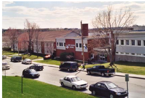
L'école de Carillon, 2002. On voit bien l'annexe centrale, qui relie les anciennes écoles de Carillon et Saint-Boniface.