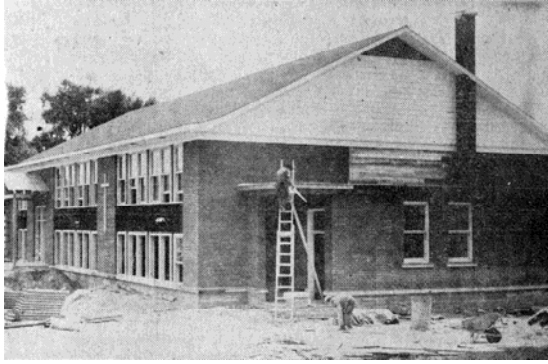
Fin des travaux de construction de l'école de Carillon, juillet 1960.