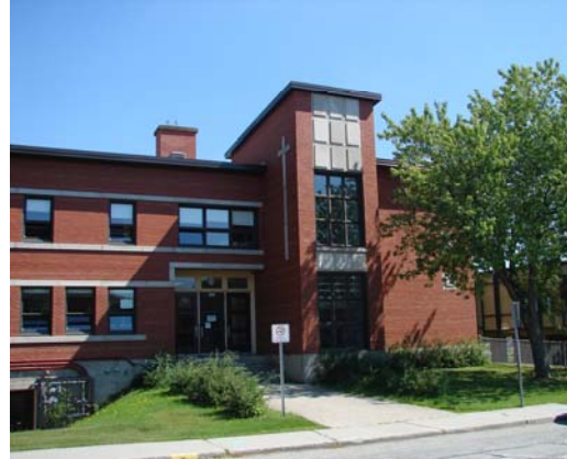
L'école du Cœur-Immaculé, 2010. Section de l'ancienne école Biron.

Les contribuables de la paroisse espèrent cependant un nouvel effort de la part de la Commission scolaire et, dès décembre 1951, une délégation demande la construction d'une nouvelle école dans le secteur, ce qui permettrait de séparer les filles et les garçons ; il faut rappeler que les premières cohortes du baby-boom font à ce moment exploser les besoins en classes. Les commissaires répondent à l'appel et