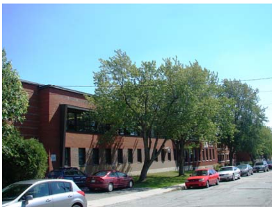
L'école du Cœur-Immaculé, 2010. À gauche, section de l'ancienne école Chalifoux.

Jusqu'aux années 1960, c'est-à-dire au cœur des réformes scolaires de la Révolution tranquille, chaque paroisse catholique espère avoir deux écoles pour son territoire, lorsque la densité démographique le permet ; une école de filles et une autre pour les garçons, idéalement prise en charge par une communauté de religieuses et de religieux respectivement. C'est dans ce contexte qu'il faut comprendre l'histoire de l'école du Cœur-Immaculé, née de l'union des anciens établissements séparés pour filles et garçons.