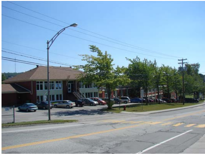
L'école Desranleau, 2010. On remarque les différentes annexes ajoutées à la droite du bâtiment original.

Entre temps, dès janvier 1964, les commissaires de la CECS évaluent la pertinence de faire construire une nouvelle école dans le même secteur. Les commissaires abandonnent l'idée de faire construire une nouvelle école en décembre 1964 et décident plutôt d'agrandir l'école déjà en place de huit classes, d'une maternelle et d'une grande salle. Ainsi, les commissaires