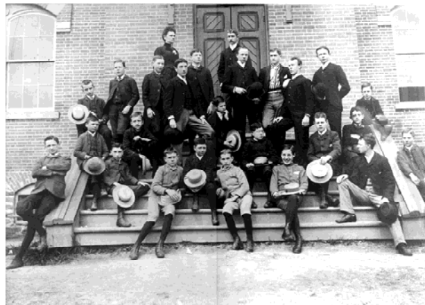
Classe du Young Men's Academy , 1888.

L'école Mitchell est l'héritière de l'un des plus anciens établissements scolaires de la Ville de Sherbrooke. De fait, c'est en 1878 qu'est fondé le Young Men's Academy , au coin des rues London, Portland et Queen (aujourd'hui boul. Queen-Victoria). L'institution relève à cette époque de la Commission scolaire protestante de Sherbrooke et accueille les garçons. Suite à la construction d'un nouveau