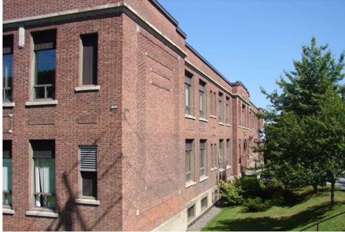
Le pavillon Mitchell, 2010.

La CSRE loue donc l'école Mitchell à partir de septembre 1969 et en fait temporairement une école secondaire pour filles. Les destinées des deux écoles secondaires sont cependant de plus en plus reliées. En effet, les commissaires décident d'utiliser l'école Mitchell pour les besoins des filles et garçons de secondaire