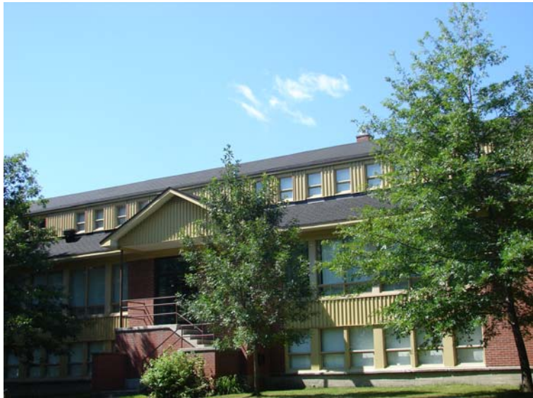
Pavillon Pie-X, août 2010.

Les deux établissements ont droit à un agrandissement de quatre classes au début de la décennie 1960. Le contrat d'agrandissement de l'école Pie-X est accordé en août 1961, alors que celui de l'école de l'Assomption est accordé en mai 1962. Par ailleurs, c'est en 1967 que la collaboration entre les deux institutions