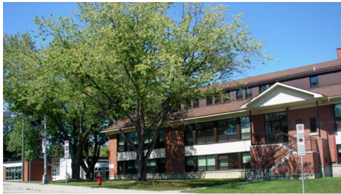
L'école du Saint-Esprit, août 2010.

L'évolution démographique du quartier force les commissaires à réévaluer l'utilisation des deux établissements. Tout d'abord, les commissaires autorisent un agrandissement de l'école du Saint-Esprit qui se concrétise en 1967-1968. Les deux écoles se partagent la