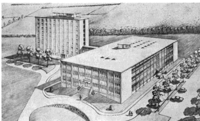
Esquisse de l'École normale de l'Estrie et de la résidence ; aujourd'hui, respectivement le pavillon no 1 du Triolet et Centre administratif de la CSRS.

Les bâtiments aujourd'hui connus comme le Centre administratif de la CSRS et le pavillon no 1 sont les premiers érigés sur le site. Dès 1960, le gouvernement provincial québécois songe à faire construire une nouvelle école normale à Sherbrooke ; école qui forme les futurs professeurs et qui est, en quelque sorte, « l'ancêtre » des facultés