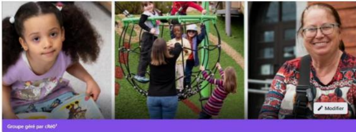
Communauté Parents de l'école LaRocque

https://www.facebook.com/share/g/1wJ5uottHu49amH5/?mibextid=K35XfP