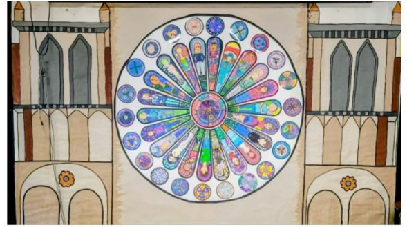
Notre-Dame de Paris présenté le 14 mai à 19h00 pour les parents et familles – places limitées !

À Paris, au cœur de la cathédrale Notre-Dame, les destins de Quasimodo, Esmeralda et Claude Frolo s'entremêlent. A mour, justice et différence s'affrontent dans une société parfois cruelle. Un récit poignant sur la beauté du cœur et la quête de liberté.