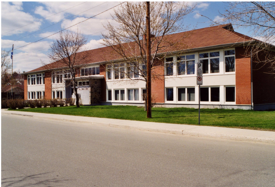
L'école Brébeuf, 2002.

Autres dénominations pour l'établissement : s.o.