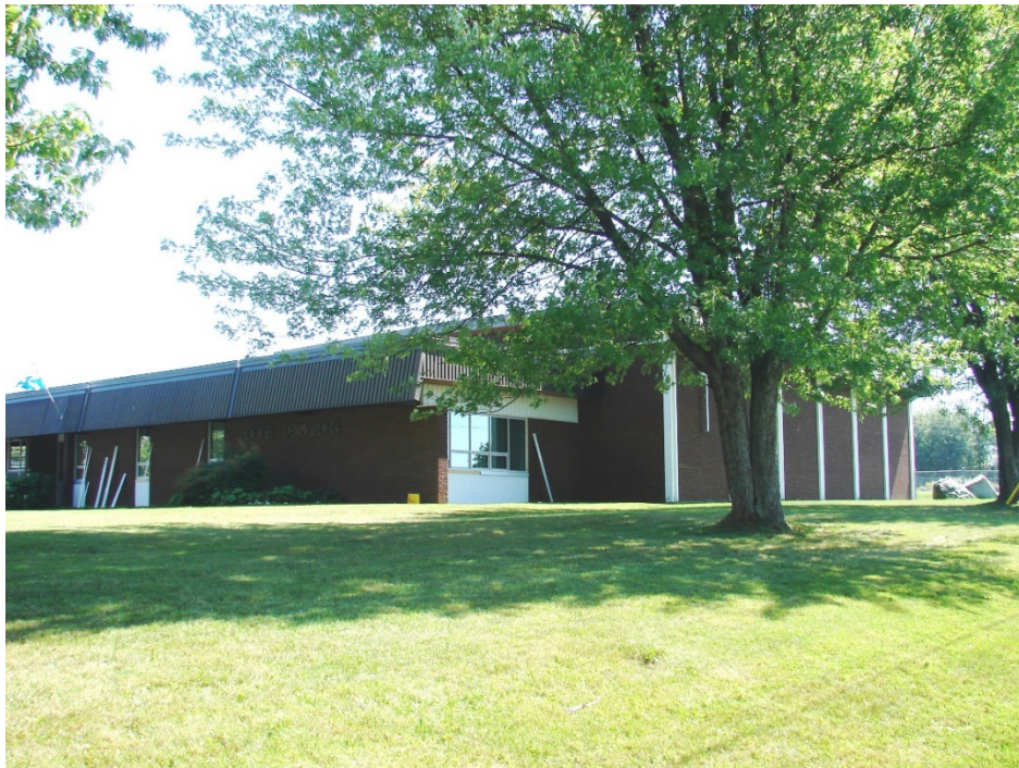
L'école Desjardins, août 2010.

Autres dénominations pour l'établissement : s.o.