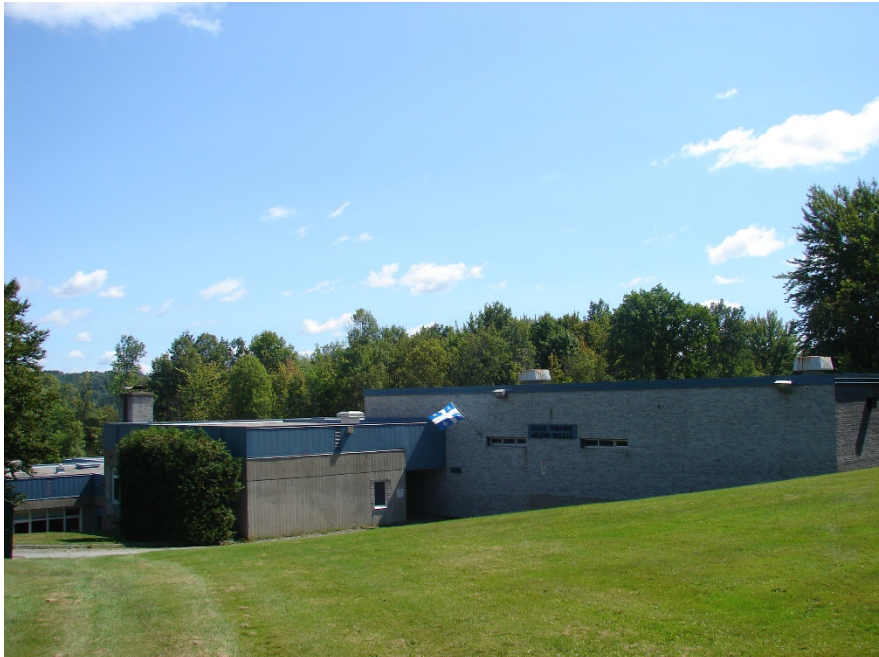
L'école Hélène-Boullé, août 2010.

Autres dénominations pour l'établissement : s.o.