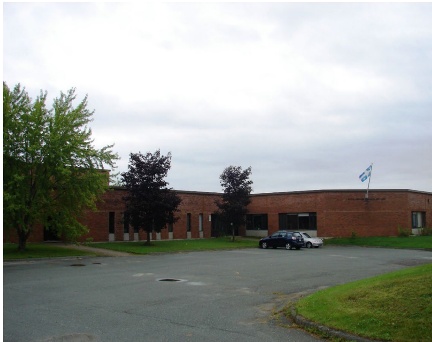
L'école du Jardin-des-Lacs, août 2010.

Autres dénominations pour l'établissement : s.o.