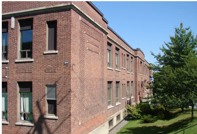
Le pavillon Mitchell, 2010.

Autres dénominations pour l'établissement : Young Men's Academy , Sherbrooke High School et Mitchell Elementary School