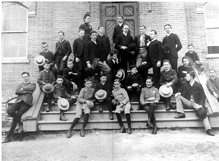
Classe du Young Men's Academy , 1888.

1878 : fondation du Young Men's Academy , au coin des rues London, Portland et Queen, par le Bureau des commissaires d'écoles protestants de la Cité de Sherbrooke 1