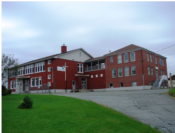
L'école Notre-Dame-de-la-Paix, août 2010. On voit bien les différentes sections de l'école : la partie de droite correspond à l'ancienne école, alors que la section de gauche ainsi que le passage ont été construits en 1957-58.

Autres dénominations pour l'établissement : École no 1 ou école centrale du village (1922-1958)