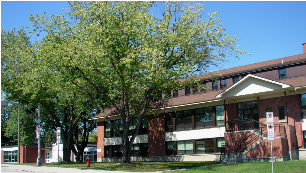
L'école du Saint-Esprit, août 2010.

Autres dénominations pour l'établissement : s.o.