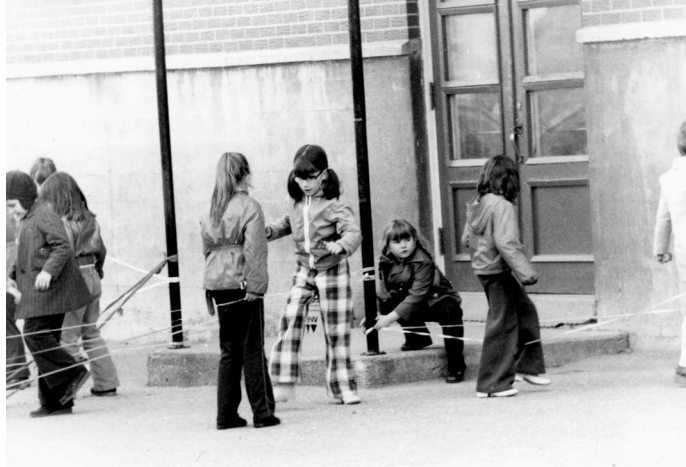
Jeux dans la cour d'école, 1974.

15 février 2005 (CC 2005-808) : les commissaires acceptent l'acte d'établissement modifié de l'école primaire du Saint-Esprit (voir document 1-57-299) 28