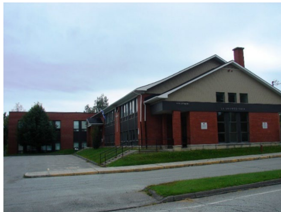
L'école de la Source-Vive, août 2010.

Autres dénominations pour l'établissement : Collège Saint-Stanislas (1959-[197?]) et École Notre-Dame-Auxiliatrice ([197?]-1988)