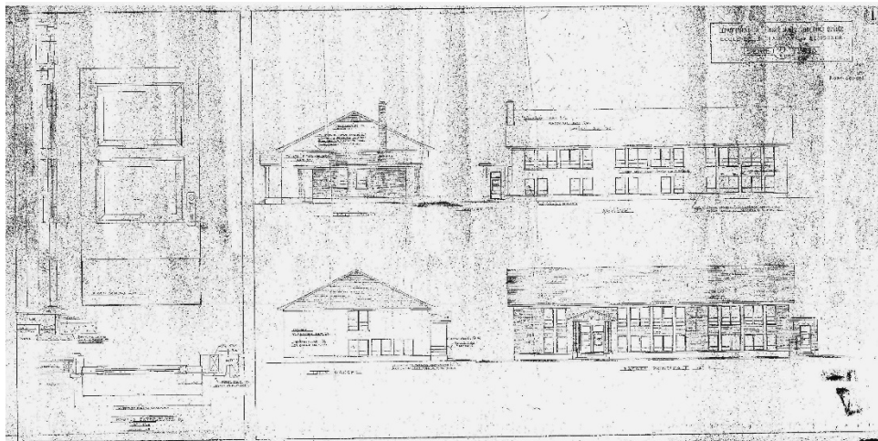
Plan de la série P-1958 du DIP, 1958. (P-037-001-001, FC.18 Plans des établissements de la CSRS)

13 janvier 1958 : les commissaires autorisent la construction d'une école de sept classes, sans logement, selon les plans et devis du DIP 3