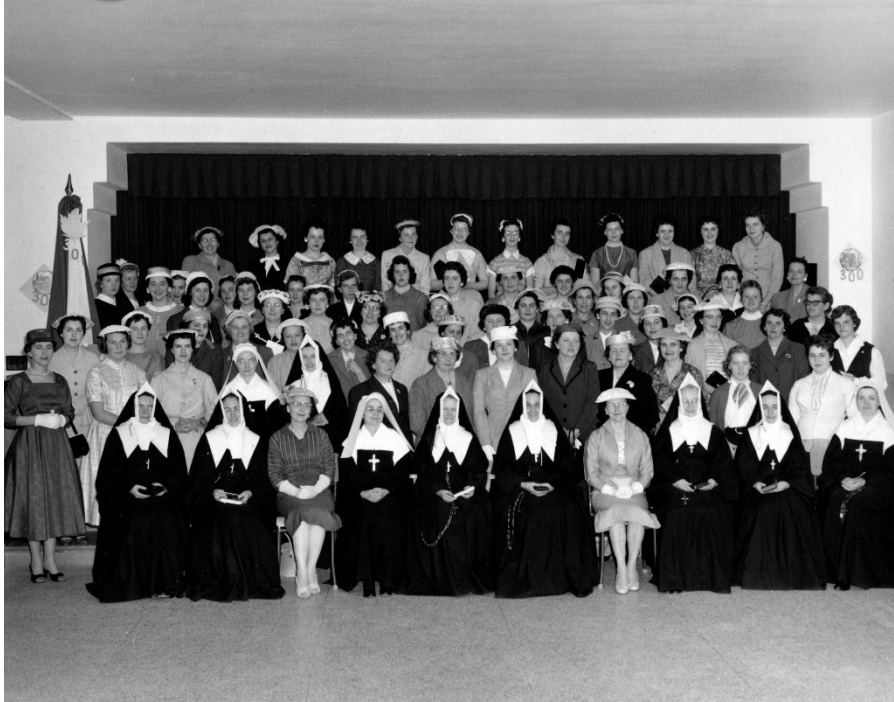
Rencontre de l'Amicale des anciennes de l'école Sainte-Jeanne-d'Arc, vers 1959.

1960 : 11 religieuses, 200 élèves 28 (Filles de la Croix)