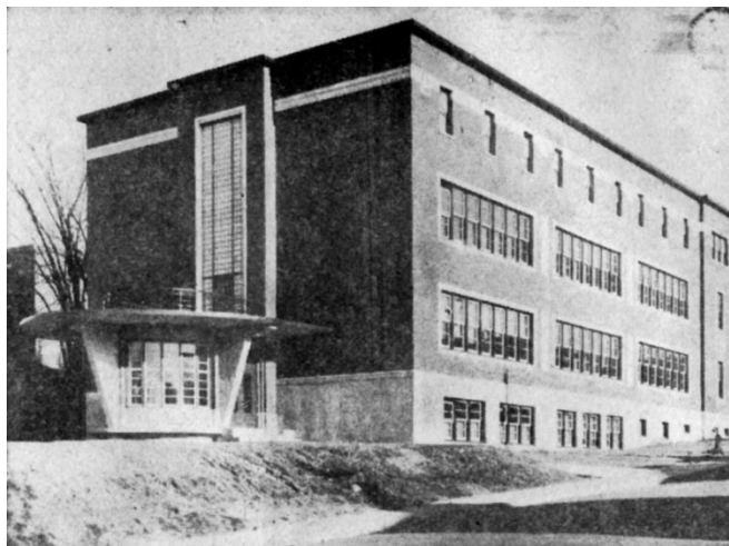
L'école Sylvestre, vers 1953. ( La Tribune , supplément « Étude économique des Cantons de l'Est », mars 1953, p. 35)

Autres dénominations pour l'établissement : École Sainte-Jeanne-d'Arc (1923-1951)