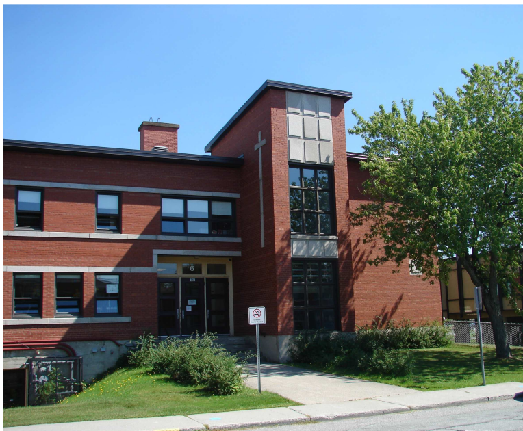
L'école Cœur-Immaculé, 2010. Section de l'ancienne école Biron.

Autres dénominations pour l'établissement : s.o.