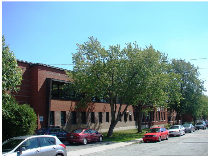
L'école du Cœur-Immaculé, août 2010. À gauche, section de l'ancienne école Chalifoux.

Autres dénominations pour l'établissement : s.o.