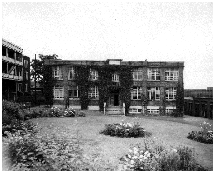
Le bâtiment à l'époque où il est encore utilisé comme manufacture par la Canadian Silk Products Limited , 1934.

Autres dénominations pour l'établissement : École d'apprentissage et Centre d'apprentissage