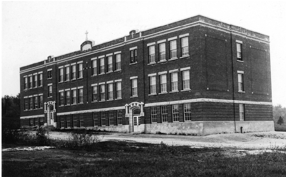
L'école Racine, vers 1923.

Autres dénominations pour l'établissement : s.o.