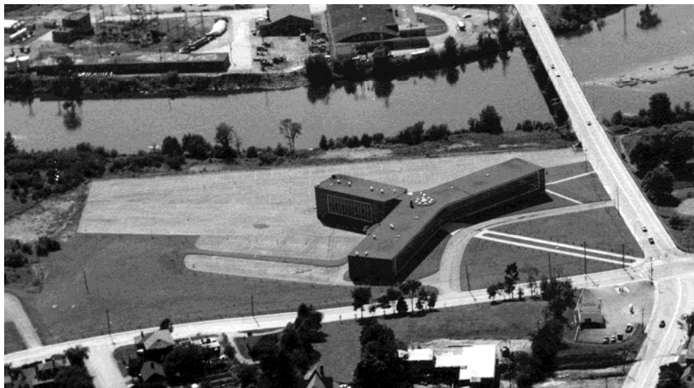
Vue aérienne de l'école secondaire Saint-François, dans les années 1960.

Autres dénominations pour l'établissement : s.o.