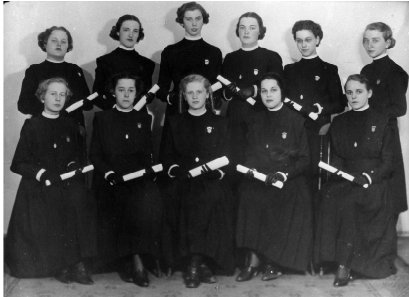
Finissantes de la 9 e année, juin 1936.