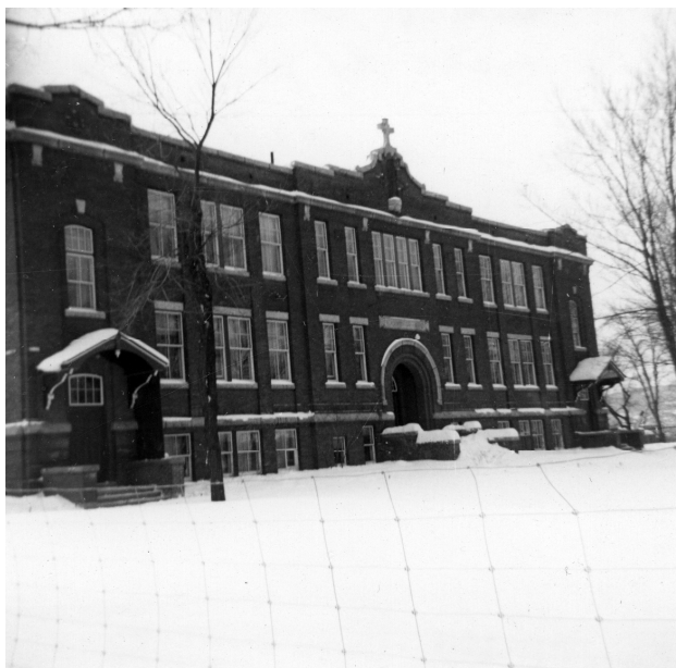
L'école Sainte-Marie, février 1950. ( Fonds Germaine Bilodeau, Société d'histoire de Sherbrooke, IP453 )

Autres dénominations pour l'établissement : Couvent de Sherbrooke-Est