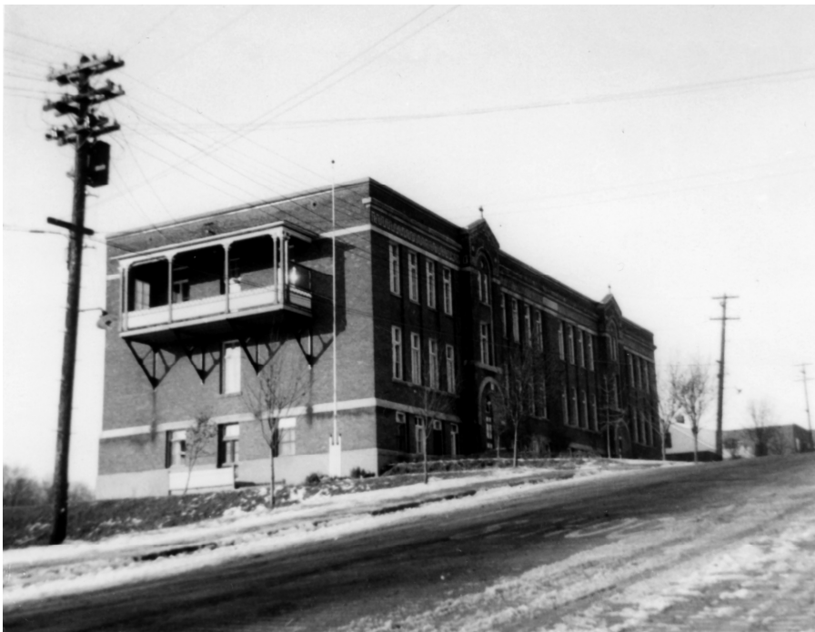
L'école Sainte-Thérèse-d'Avila, vers 1950.

Autres dénominations pour l'établissement : École Sainte-Thérèse-d'Avila (secteur des garçons, 1927-1948)