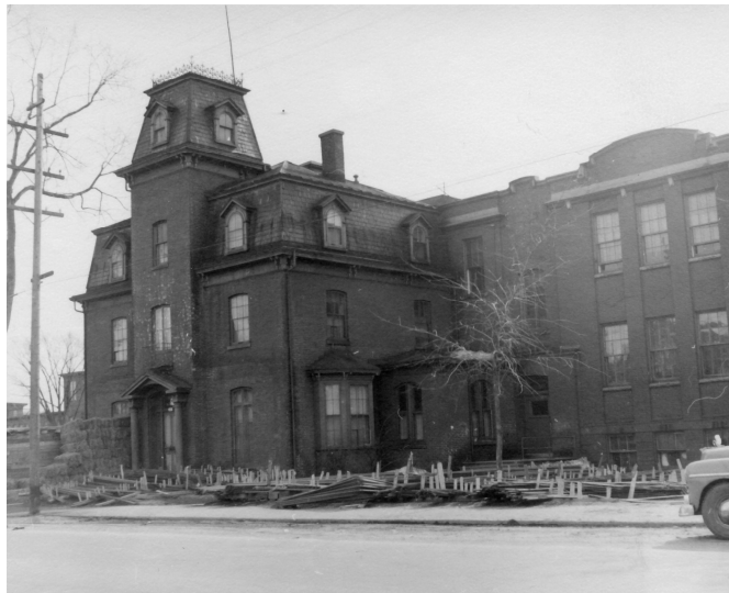
L'ancienne école St. Patrick , vers 1955.

Autres dénominations pour l'établissement : St. Patrick's School (1911-1958)