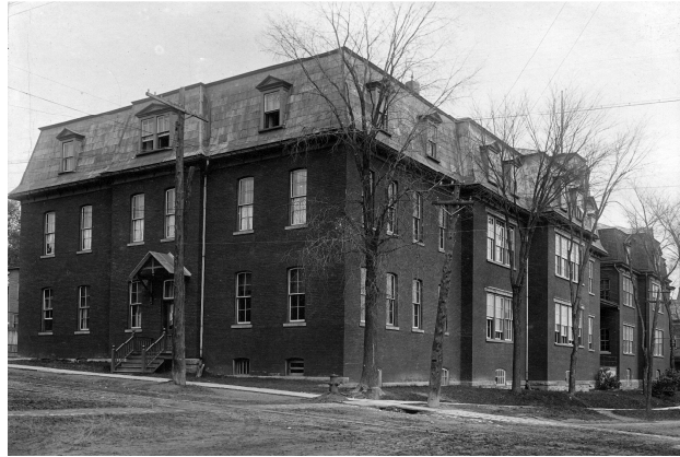
L'école du Sacré-Cœur de Sherbrooke, communément appelée « École du Centre », vers 1910.

Si les cours sont donnés jusqu'à ce moment essentiellement dans des bâtiments de type résidentiel qui accueillent rarement plus d'une ou deux classes, les premières constructions entièrement dédiées à l'enseignement et répondant un peu plus à l'image contemporaine qu'on se fait d'une école, sont érigées dans la décennie 1880. À l'été 1882, le