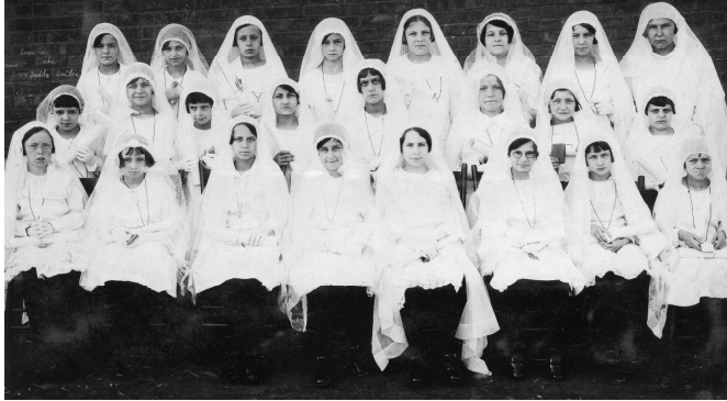
Des élèves du secteur féminin de l'école Sainte-Thérèse-d'Avila dans leurs habits de communion, 1932.

(1903, Sœurs) et l'école Saint-Antoine de Lennoxville (1891, Sœurs) qui sont d'abord prises en charge par ces deux mêmes communautés.