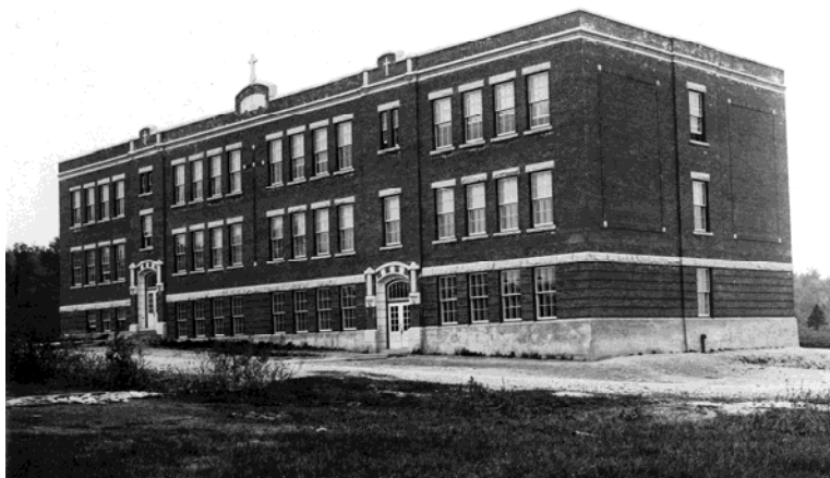
Le bâtiment des écoles Racine et Sainte-Jeanne-d'Arc, vers 1923.

En mars 1922, les commissaires prennent la décision d'acheter de la Cité de Sherbrooke un terrain au coin des rues Drummond (Galt Ouest) et Kitchener pour la somme de 10 000 $. On décide, de plus, de faire appel aux services de l'architecte J. W. Grégoire afin de