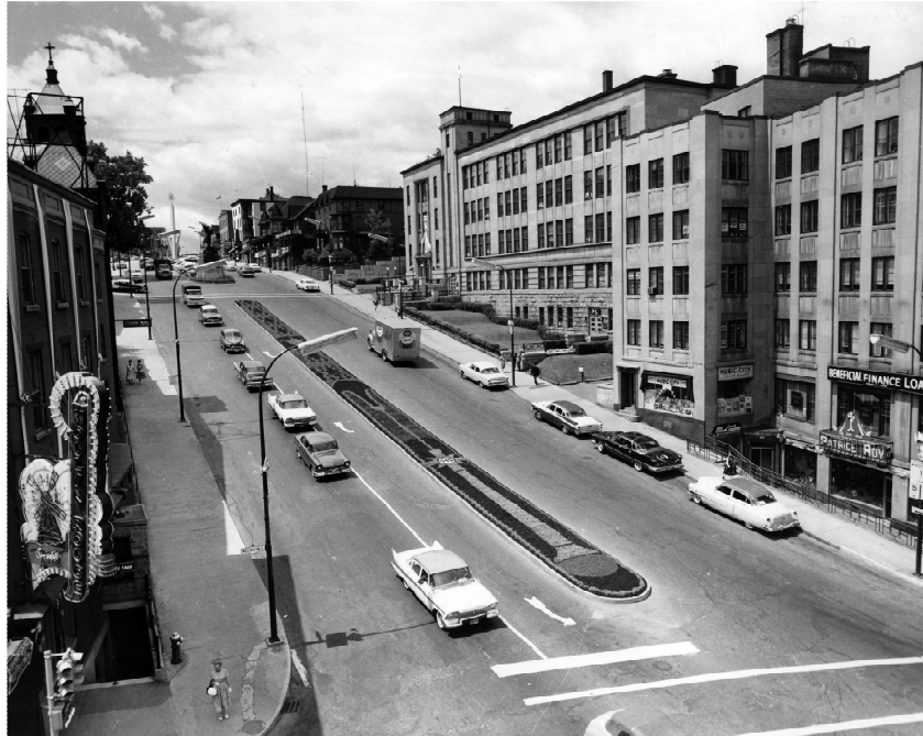
Le bâtiment de la rue King Ouest accueille le Centre Saint-Michel depuis 1975, vers 1959. (Fonds Louis-Philippe Demers, Société d'histoire de Sherbrooke, IP52)

Autres dénominations pour l'établissement : s.o.