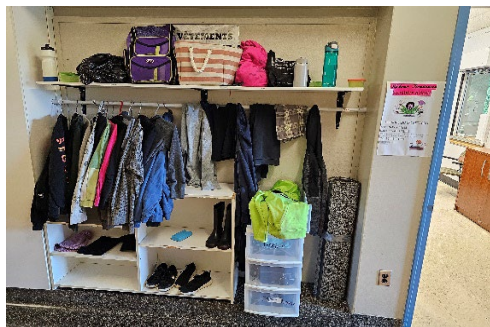
Académie du Sacré Cœur

Nous ferons l'envoi de photo régulièrement, afin que vous puissiez venir les récupérer, ou du moins que votre enfant reprenne ses choses disparus. Prenez note qu'au mois de décembre les objets non réclamer seront distribuer à des organismes de charité bien évidemment un rappel vous sera envoyé.